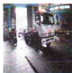
Left