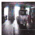
Foto Belakang Image Rear